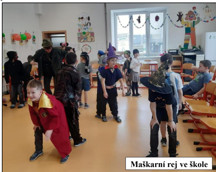
Maškarní rej ve škole

Hned poté se naše škola ponořila do vůní koření z celého světa – čekala nás úžasná projektová akce „Tvoření z koření“. Výsledkem této aktivity budou voňavé dárečky pro maminky. Sotva jsme se rozkoukali, oblékli jsme si karnevalové kostýmy v naší školní družině. Při tanci, dobré hudbě a balónkových soutěžích jsme si to pořádně užili.