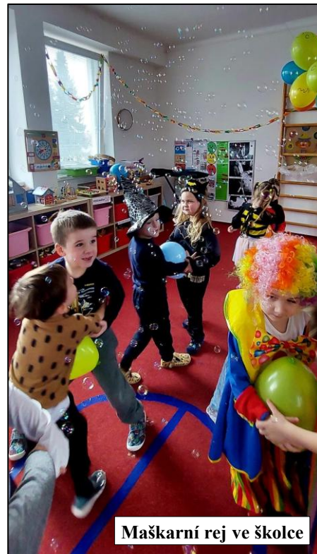
Maškarní rej ve školce

Každý den ve školce přináší dětem nové podněty, radost i prostor pro společné zážitky, které jsou důležitou součástí jejich poznávání světa.