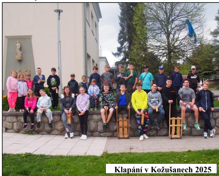
Klapání v Kožušanech 2025

Protože tento velikonoční obyčej má v dnešní době již ráz více komerční než církevní, klapači se už u svatých křížů a soch nezastavují, o modlitbě ani nemluvě.