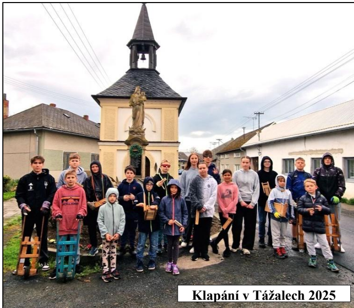
Klapání v Tážalech 2025

Ráno jsme si museli přivstat, poněvadž kromě ranního klapání jsme měli ještě za úkol přinést v nějaké větší nádobě vodu z Nemilky, potoka vlévajícího se před tážalským splavem do Moravy. Doma jsme se těsně před svítáním v této vodě všichni umývali. Byl to dávný zvyk převzatý od předků, kteří věřili, že pramenitá proudící voda má na Velký pátek významnou a zázračnou moc.