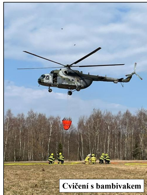
Cvičení s bambivakem

Během měsíce ledna jsme v mrazivých dnech prováděli zametání a zalévání vodní plochy na Močidle pro lepší podmínky k bruslení a také jsme 3x zabezpečili i večerní bruslení za pomoci naší osvětlovací sestavy.